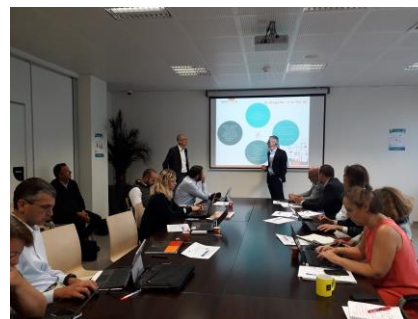
1 re Comité Technique à Grenoble (12 sept 2019) & Lancement Politique (10 oct. 2019)