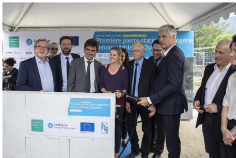
Inauguration de la 1 ère pierre de la station de Chambéry (21 juin 2019)