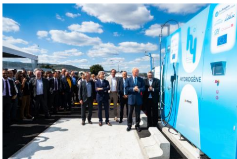
Inauguration de la station provisoire à Clermont-Ferrand (6 sept 2019)