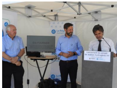
Lancement politique à Moutiers (12 juillet 2019)

GRAND LYON Lancement politique Lyon en cours de planification la métropole