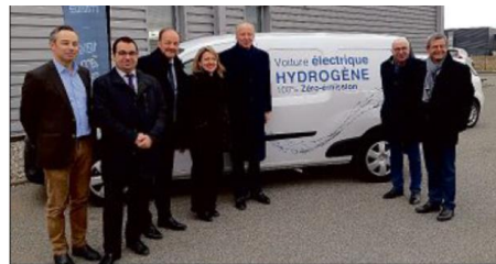
Lancement politique à Riom (1 er février 2019)

GRAND LYON Lancement politique Lyon en cours de planification la métropole